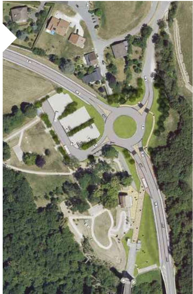
Emprise des travaux du rond-point des Ponts de la Caille.

Itinéraire de la déviation pendant la fermeture de la route de Chez Vaudey.