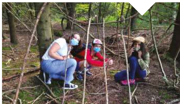
Sortie nature au parc des Dronières.

La première semaine a été l'occasion pour tous d'apprendre à se connaître, trouver ses repères, s'adapter au mieux pour respecter les gestes barrières et commencer les premiers cours. »