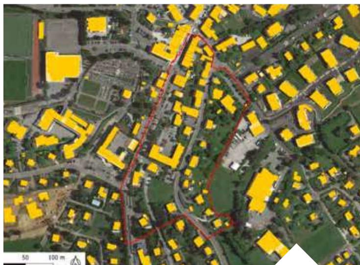
Périmètre d'étude - Secteur : Route du Suet Nord