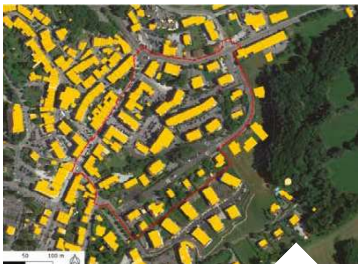
Périmètre d'étude - Secteur : Chef-lieu

Il s'agit donc d'une mesure d'urgence mise en œuvre rapidement pour freiner la densification dans l'attente de la révision du règlement du PLU.